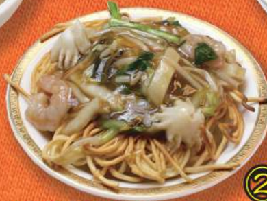
② 五目あんかけ 焼きそば