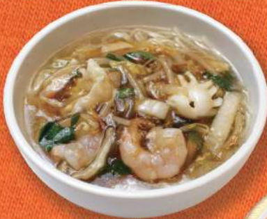
① 五目 スープそば