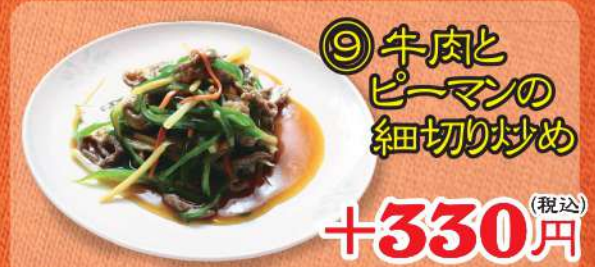
⑨ 牛肉と ピーマンの 細切り炒め