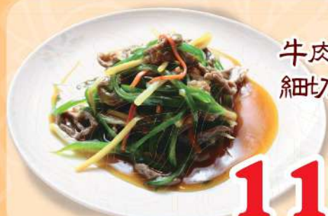
牛肉とピーマンの細切り炒め