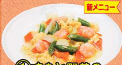
① 海老と野菜の 塩味玉子炒め