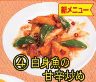
④ 自身魚の 甘辛炒め