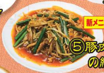
⑤ 豚肉とモヤシ の細切り炒め