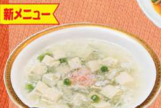
⑥ 蟹肉と豆腐 の煮込み